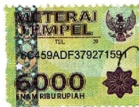
DESMIARTI NIM. 1224082

Pasir pengaraian, Juli 2015 Yang membuat pernyataan,