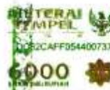
Nur Utami Nim. 1424091