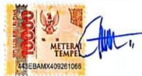
Yuyun Endah Wulandari NIM.2133020