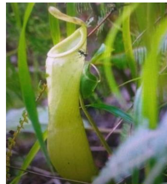
Gambar 1. Nepenthes mirabilis (Tarigan 2022:203)