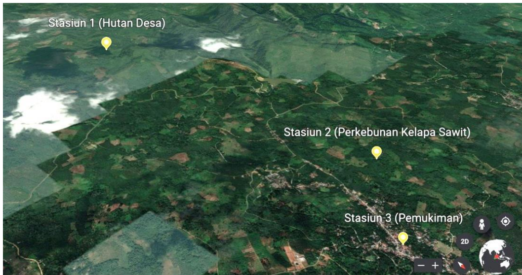
Gambar 2. Lokasi pelaksanaan penelitian di Desa Rambah Tengah Barat Kecamatan Rambah Kabupaten Rokan Hulu.

Penelitian ini telah dilaksanakan pada bulan April 2023 sampai bulan Juli 2023 di Desa Rambah Tengah Barat Kecamatan Rambah Kabupaten Rokan Hulu dengan membagi tiga stasiun yaitu, kawasan hutan desa, kawasan perkebunan kelapa sawit, dan kawasan pemukiman, kemudian dilanjutkan di Laboratorium Pendidikan Biologi, Fakultas Keguruan dan Ilmu Pendidikan Universitas Pasir Pengaraian.