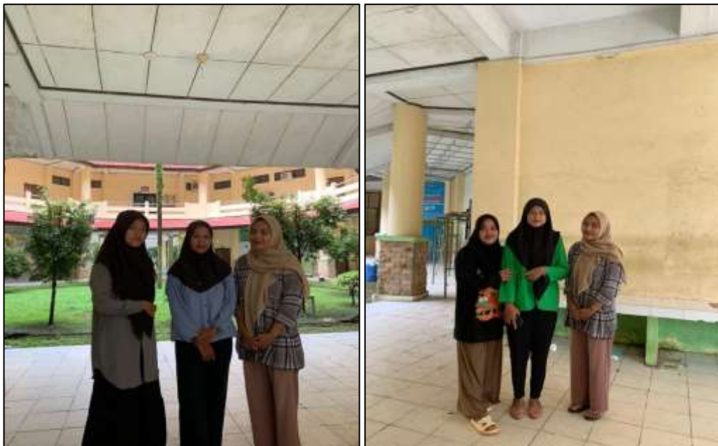
Gambar 1.1 Dokumentasi Interview

Universitas Pasir Pengaraian. Dengan reputasi yang unggul, program studi ini terus menjadi pilihan utama bagi mereka yang ingin meniti karir di bidang Manajemen dengan landasan pendidikan yang kuat.