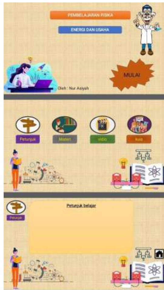
Gambar 2.1 Desain PPT Interaktif Yang Akan di pakai