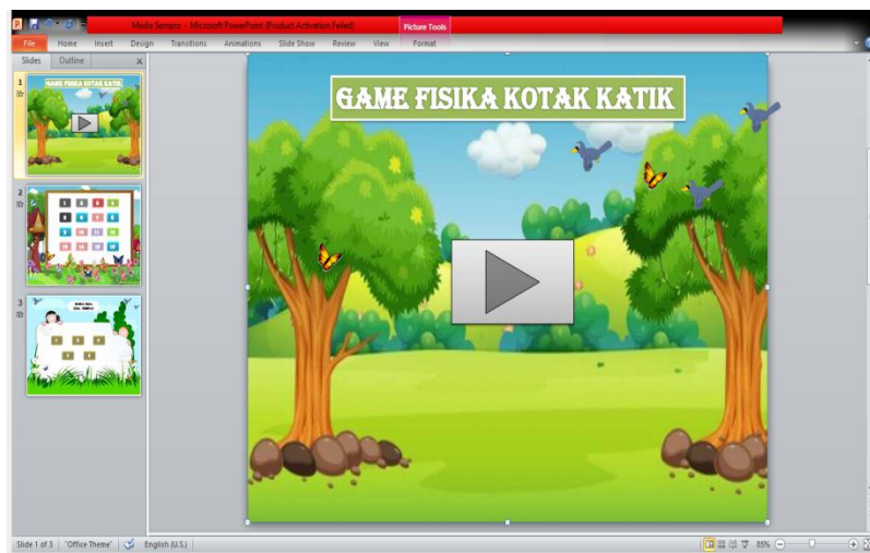
Gambar 2. 1 Desain Game Kotak Katik

Game kotak katik dapat membantu siswa memahami materi yang dianggap sulit, seperti reaksi redoks, dengan cara yang lebih interaktif dan menyenangkan (Yulianingtyas et al. 2017).