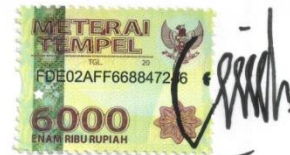
UMI LATIFAH NIM: 1524046