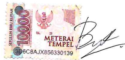
Bahrul NIM. 182400