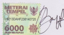
BAYU ADITYA SAPUTRA