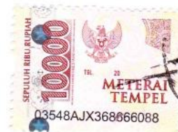
Risa Anggraini NIM : 1724073