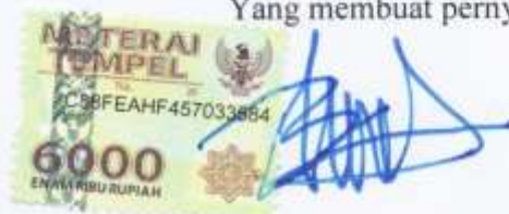
Riki Afrilian NIM.1624001